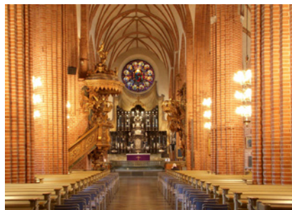
Kyrkorummet efter renoveringen 2010.

Storkyrkan är en femskeppig hallkyrka uppförd av tegel. Planen är något oregelbunden rektangulär, med fullbrett rakslutet kor. Det västra tornet flankeras av två utbyggnader. Ett trapphus är tillfogat till det södra. Fasadernas barockutformning bryter mot interiörens gotiska formspråk. Strävpelarna har utformats som lisener med bandrustik. Horisontallinjen förstärks genom den kraftiga taklisten och tornet livas upp av hörnkedjor, frontoner och